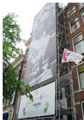
voorgevel tijdens restauratie