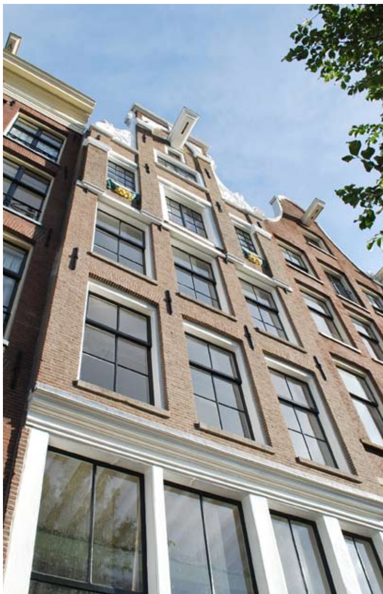
voorgevel na restauratie

Dit project heeft ons, de opdrachtgever en aannemer goed inzicht gegeven in de mogelijkheden en beperkingen bij duurzaamheidsingrepen in monumentale context.