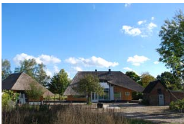
werkplaats, woohuis en bakhuis, zicht vanaf de erfzijde