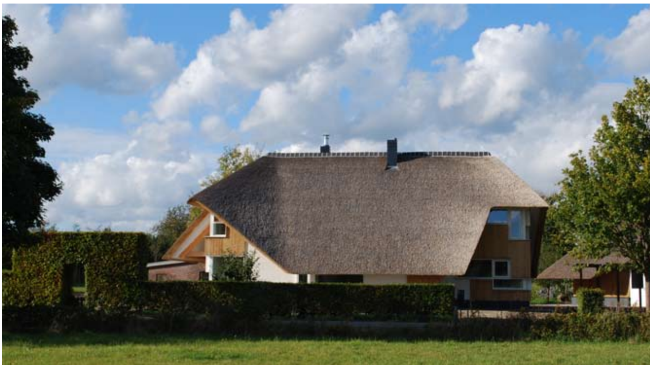
Zicht vanaf de straat

De woning is ontworpen vanuit een duurzaam installatieconcept. Gevels en dak zijn extra goed geïsoleerd. De weinige energie nog benodigd wordt gehaald uit een houthaard, die geïntegreerd is met een hoog rendement verwarmingsketel. Ook wordt warmte teruggewonnen uit afvalwater en ventilatielucht. Het huis wordt opgetrokken uit betongevulde houtvezelcementblokken, een systeem uit de Alpen dat de warmteaccumulatie van een stenen huis combineert met de damp open eigenschappen van houtmassiefbouw.