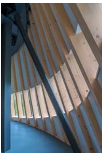
onder de huid...